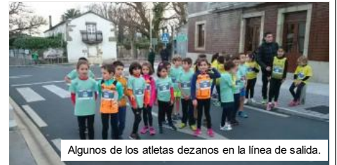
Algunos de los atletas dezananos en la línea de salida.