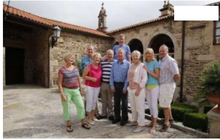
Los peregrinos irlandeses, ayer, a su llegada al Pazo de Bendoiro, donde pasaron la noche.

Tres etapas les separan de su destino, Compostela, y hoy su caminata transcurre por tierras de Trasdeza, donde tienen previsto pasar la noche.